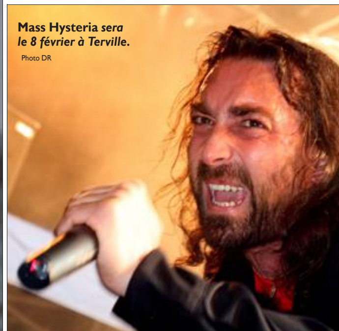
Mass Hysteria sera le 8 février à Terville.