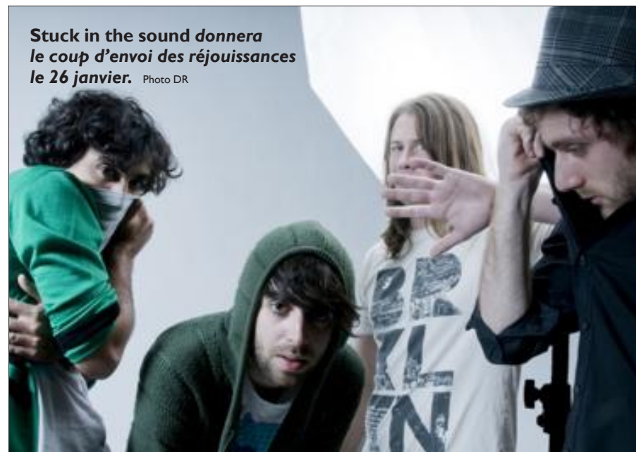
Stuck in the sound donnera le coup d'envoi des réjouissances le 26 janvier.

Cinq dates sont au programme du 112 de Terville et non des moindres. Du 26 janvier au 2 mars, Sound in the sound, Mass Hysteria, Les Puppetmastaz, La Grande Sophie et Pete Doherty seront sur scène. Puis la salle terவில்oise fermera ses portes pour huit mois.