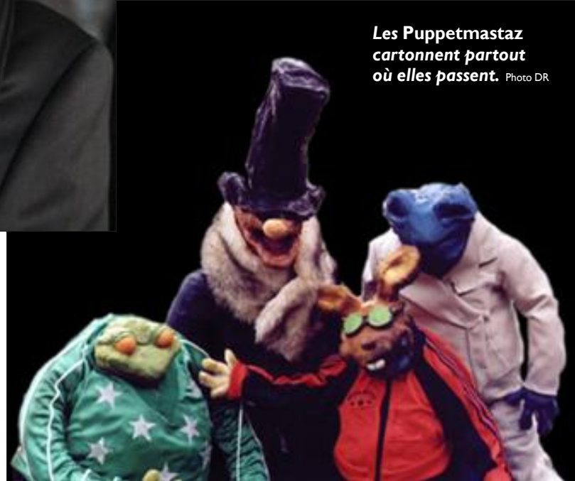
Les Puppetmastaz cartonnent partout où elles passent.