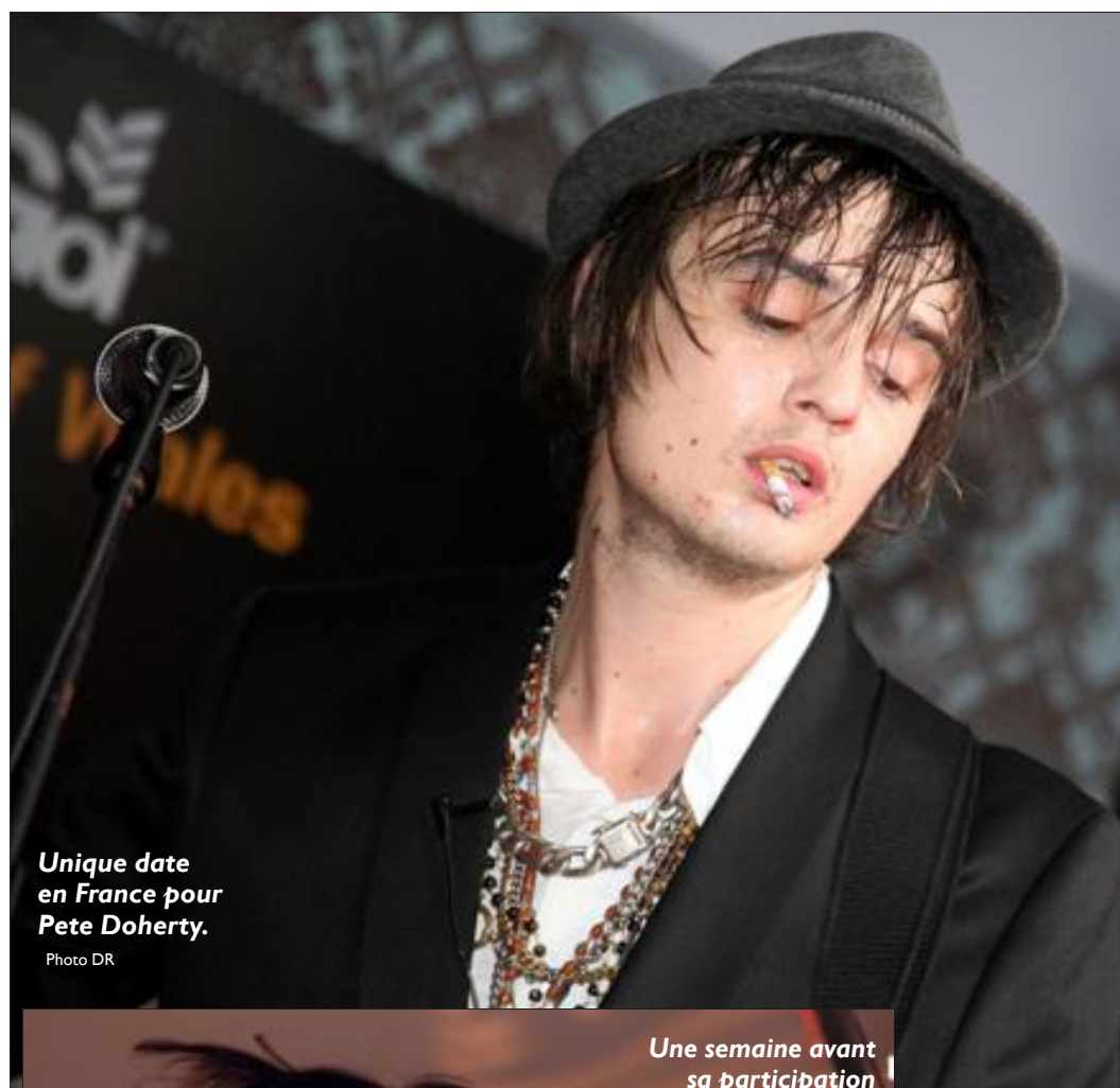
Unique date en France pour Pete Doherty.