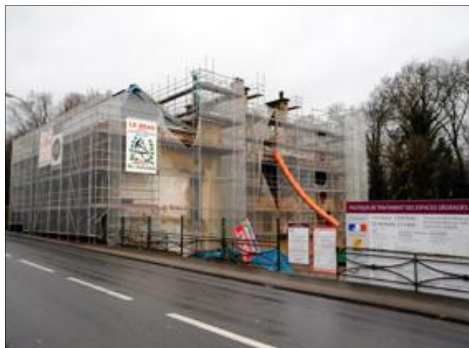
La construction du nouvel hôtel communautaire, à Hayange, est le chantier le plus important de l'année.

Des travaux qui continuent, des projets qui voient le jour : en 2013, la Communauté d'agglomération du Val de Fensch va investir 20 M€ sur son territoire. Le chantier le plus important concerne la construction de l'hôtel de communauté, sur le site de l'ancien château de Wendel à l'entrée de Hayange. Des travaux sont déjà en cours dans les deux seuls bâtiments préservés. Ces deux ailes vont être rénovées, et un nouveau bâtiment construit ainsi qu'un parking. Fin des travaux prévue pour 2014.