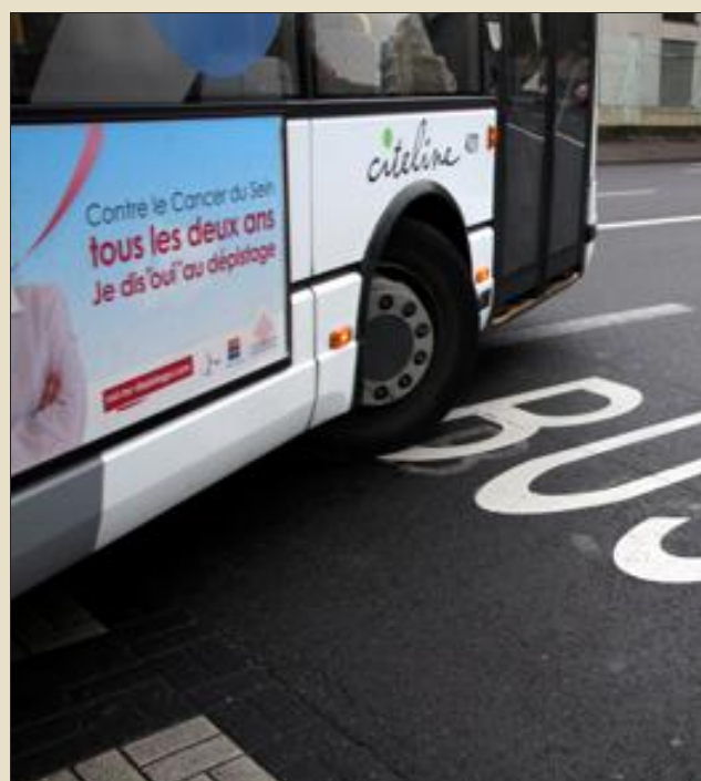
À bout de patience, le chauffeur du bus a tout stoppé et tout verrouillé jusqu'à l'arrivée de la police.

Une agression dans un bus, vendredi matin, conduira un individu devant le tribunal correctionnel de Thionville, en avril prochain. L'altercation vaut à un chauffeur de la Trans Fensch une interruption totale de travail de trois jours ainsi qu'un arrêt maladie jusqu'au 15 janvier prochain.