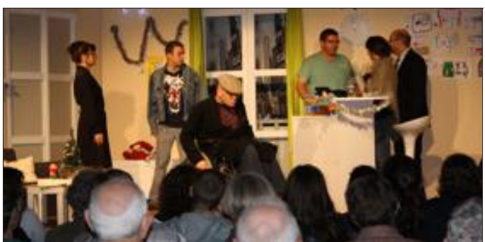
Les Baladins du Val sierckois poursuivent leur tournée jusqu'au 1 er décembre.

Un chirurgien renommé se trouve engagé dans une situation de paternité, à laquelle il ne s'attendait pas du tout. Et c'est un imbroglio inextricable qui démarre dont il ne pourra se sortir qu'en accumulant mensonges et actes les plus fous. Rires assurés tout au long de la soirée. Les Baladins du Val sierckois ont superbement interprété cette pièce de Ray Cooney, mise en scène par Marie Veynachter. Le public a apprécié cette première soirée théâtrale au foyer socioculturel.