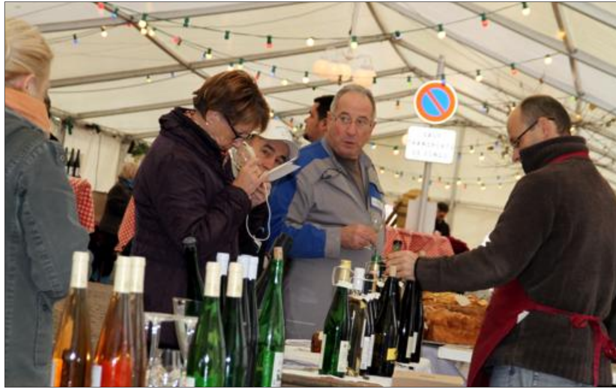
Le Salon des vins blancs de Sierck attire les viticulteurs mais aussi les amateurs de breuvages qui apprécient forcément de déguster mais aussi de découvrir des saveurs d'ailleurs.