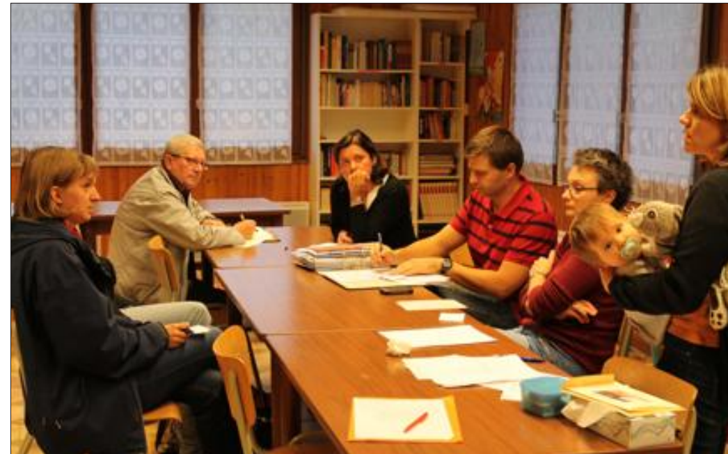
Présentation d'une année bien remplie.