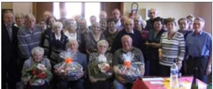
Des cadeaux ont été remis aux doyens de l'assemblée.

Grand soleil à l'extérieur, ambiance chaleureuse à l'intérieur. Comme toujours c'est avec un grand plaisir que les aînés de Ritzing et Launstroff se sont retrouvés dimanche dernier au foyer socio-éducatif à Launstroff pour le traditionnel repas offert par les deux municipalités. La plupart des personnes se connaissant depuis l'enfance, elles ont échangé anecdotes et souvenirs tout en se régaland des bons petits plats servis par les élus et leurs conjoints. Elles