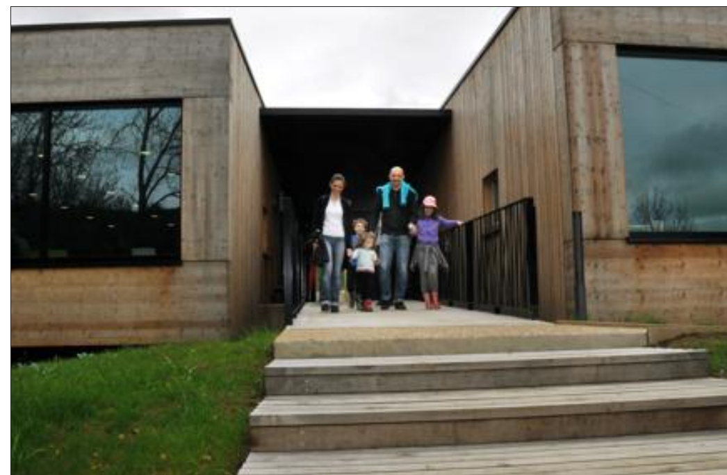
Les premiers curieux ont découvert hier la maison de la Nature de Montenach. Le lieu a fait l'unanimité.

Ça y est, elle est ouverte. Celle qui, il y a de cela deux ans, n'était qu'un projet, a accueilli hier ses premiers visiteurs. Anne, Charline, Salomé et les autres étaient là pour leur faire découvrir La Cabane, située au pied de la réserve naturelle de Montenach. Le temps aidant, beaucoup