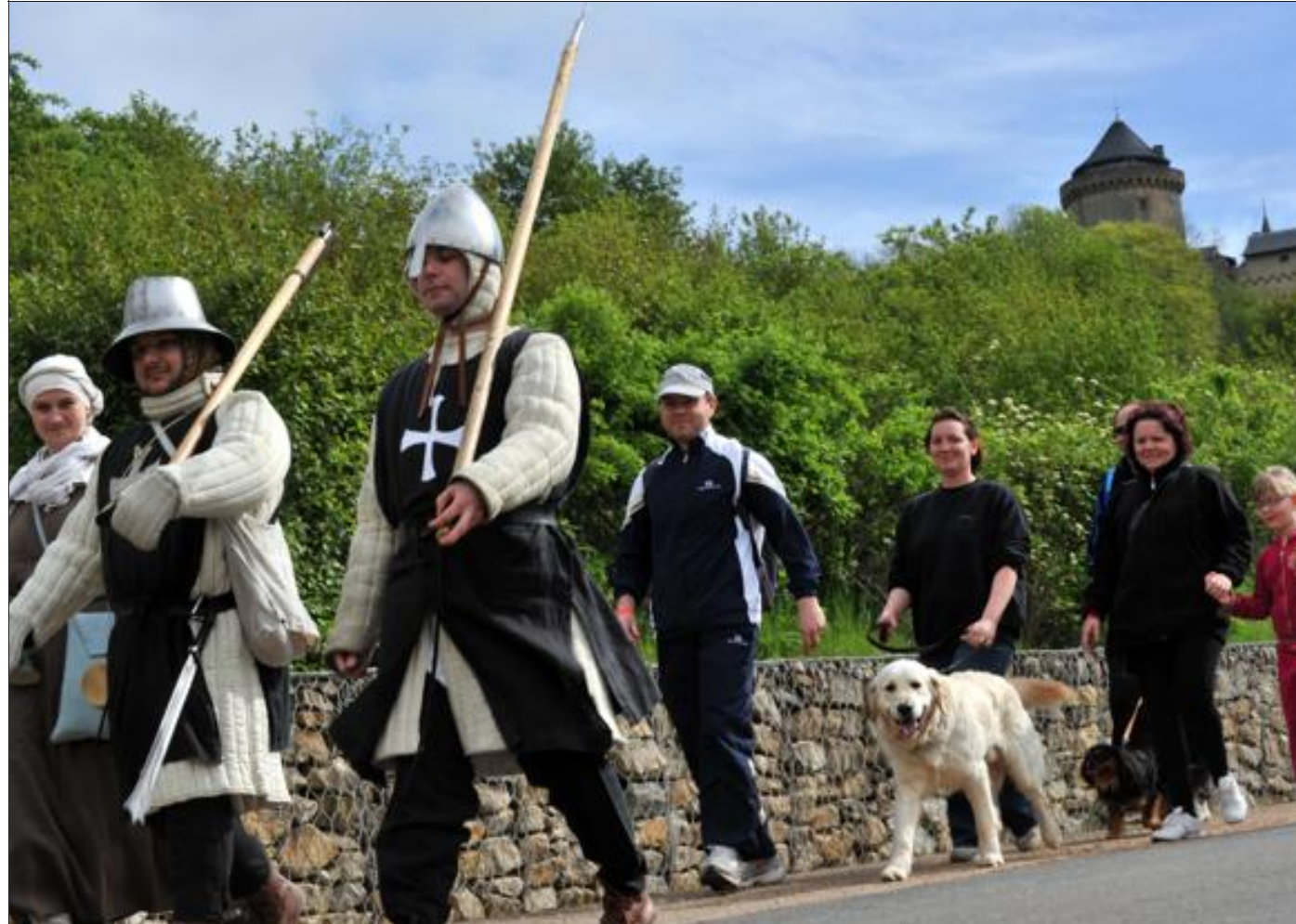
La Marche des Seigneurs entre Sierck et Manderen a séduit les participants par son concept qui mêle balade, animations et histoire.