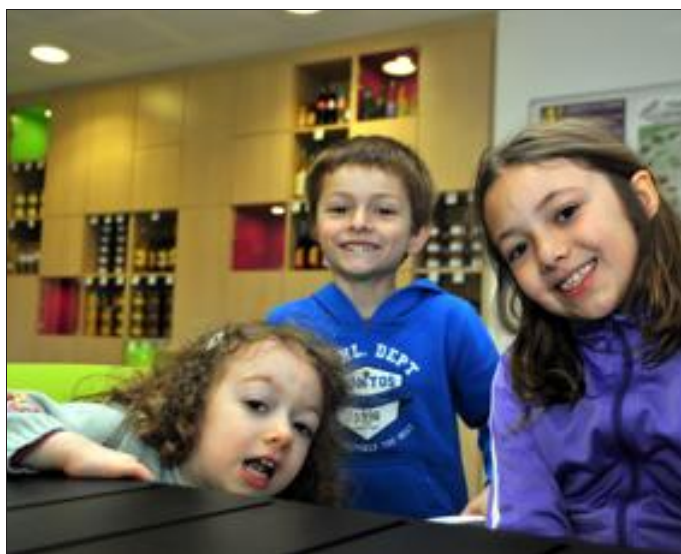
Les enfants apprécient particulièrement ce nouveau lieu.

Hier, la maison de la Nature a ouvert ses portes à Montenach. Les premiers curieux sont venus l'admirer et s'y sont sentis comme chez eux. Un début prometteur.