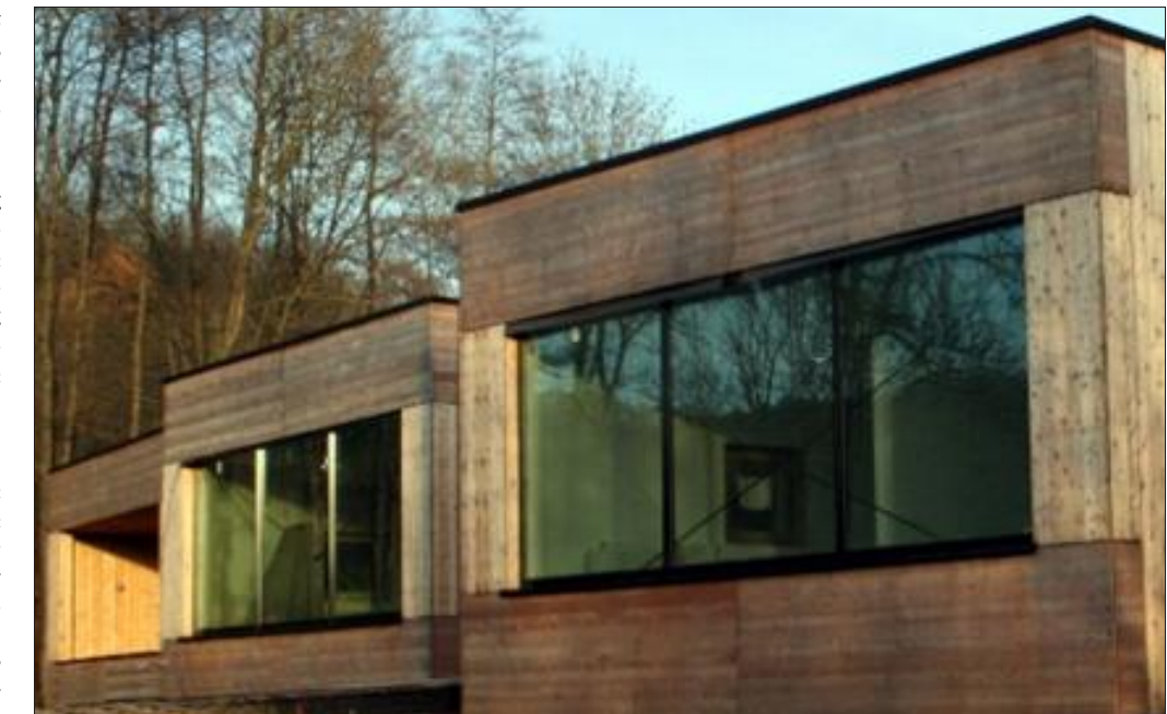
Extérieurement, la maison de la nature mérite le détour. Pour apprécier l'intérieur et découvrir l'exposition et ateliers, rendez-vous le 1er mai de 9h à 18h, à Montenach.

Anne Jolas ne tient plus en place. Celle qui a été recrutée en janvier 2011 comme chef de projet de la maison de la nature voit enfin le bout d'une trop longue attente. « Dans trente jours, le 1er mai, la Cabane ouvrira enfin ses portes. » Un véritable soulagement pour elle mais aussi pour la communauté de communes des Trois Frontières qui en rêve depuis des années.