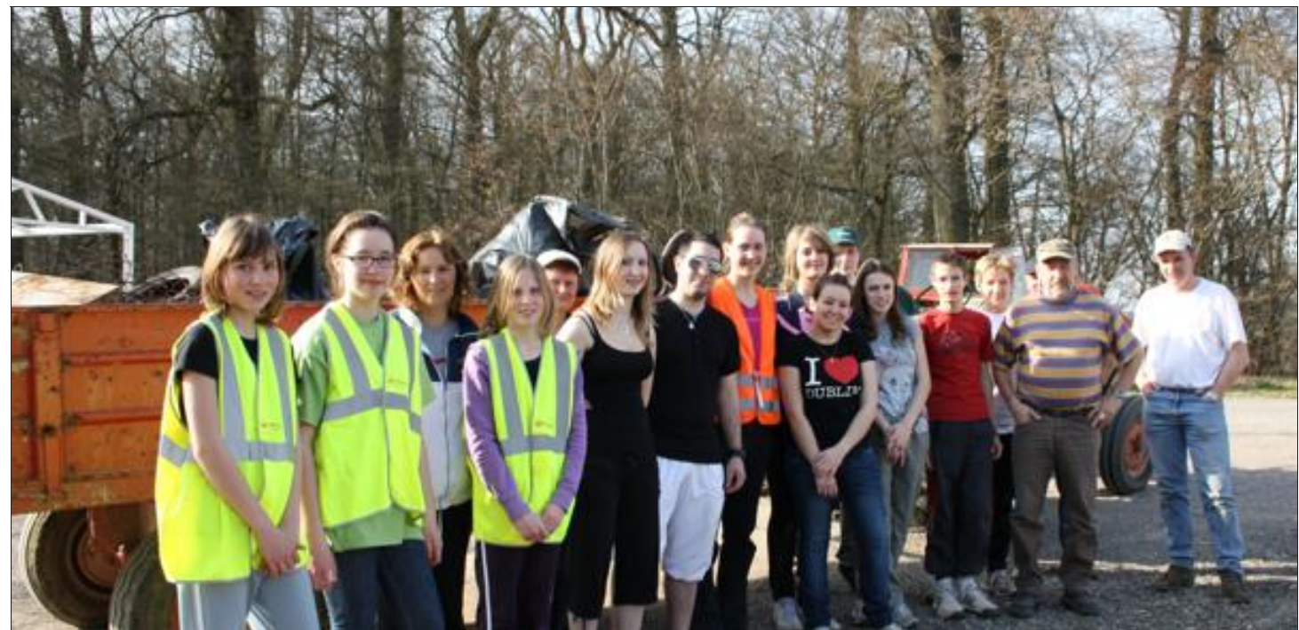
Des participants soucieux de l'environnement ont pris part à la journée.

La moisson a été abondante. Les campagnes de sensibilisation au respect de la nature et de l'environnement ont encore du chemin à parcourir !